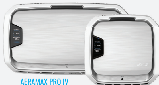
AERAMAX PRO IV FINO A 130mq

INTELLIGENTI: Tecnologia brevettata PureView che mostra in tempo reale la qualità dell'aria